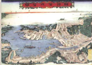
■横須賀一景図(明治14年)

横須賀港は、今から約150年前の嘉永6年(1853年)、米国ペリー艦隊の黒船が浦賀に來航して以来、横須賀製鉄所、海軍工廠、軍港として発展を遂げました。横須賀ならではのクルージングをお楽しみください。